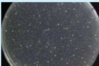
コロニーあり(菌の増殖あり)