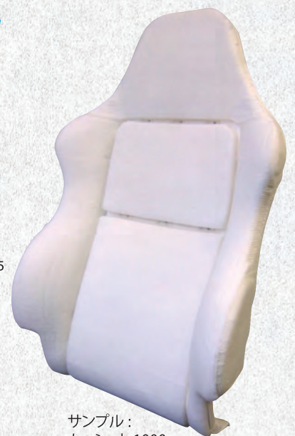
サンプル： カーシート 1000g